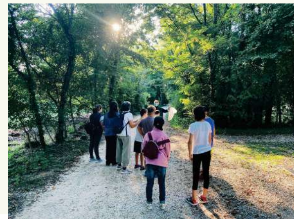
Un'uscita nel territorio.