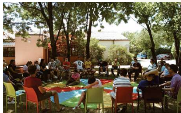
Un'attività di gruppo assieme all'équipe del Centro.

La Cooperativa si avvale di personale specializzato e investe in modo continuativo sull'aggiornamento professionale.