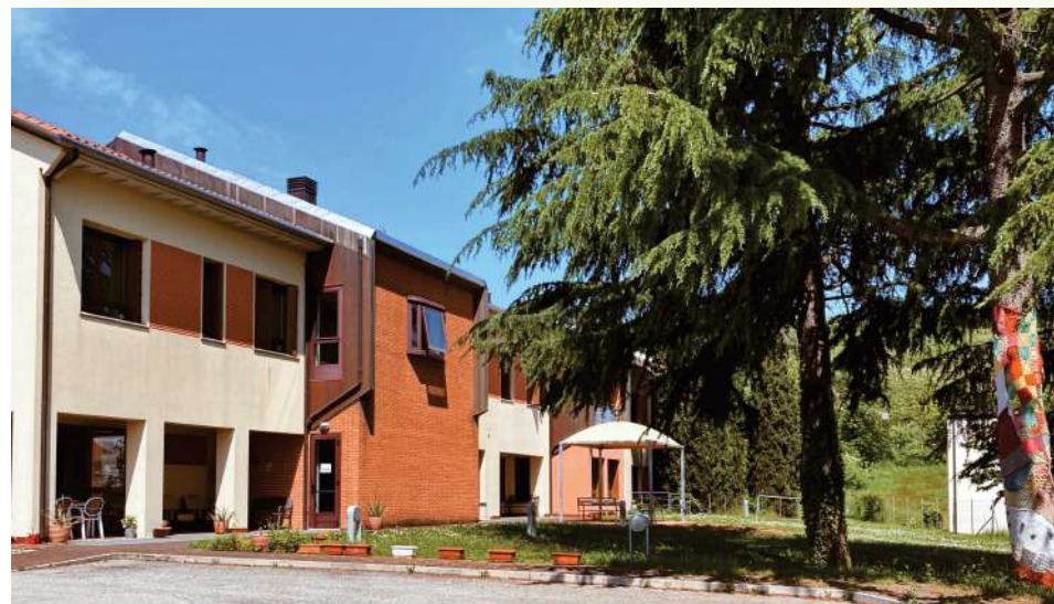
La Comunità alloggio Casa dei Giacinti, 2023

L'équipe lavora con il territorio per individuare delle opportunità di scambio e inclusione delle persone nel territorio, favorendone l'integrazione nel tessuto sociale di appartenenza.