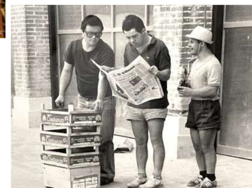
A destra, al Centro diurno di Castelfranco ci si prepara per la raccolta delle coltivazioni, 1983.

Nel corso di pochi anni, grazie alla collaborazione dei Comuni dei territori e alla disponibilità dell'Azienda ULSS n. 2 Marca Trevigiana, sono nati i Centri diurni di Asolo , Castelfranco e Montebelluna (nel 1982), il Centro diurno di Pederobba (nel 1987) e il Centro di Lavoro Guidato a Vedelago (1990).