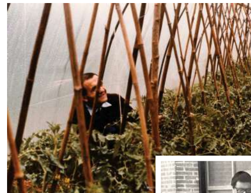
A sinistra, le coltivazioni nella serra del Centro diurno di Montebelluna nel 1985.

Nel dicembre 1981 , un gruppo di genitori di persone con disabilità fonda Vita e Lavoro, una Cooperativa agricola artigianale che aveva lo scopo di impegnare i propri figli, favorirne la crescita e l'inserimento nella società.