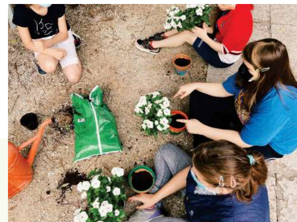
Bambini e ragazzi del progetto Stella Polare impegnati nell'attività di cura del verde.

È possibile accedere al servizio sia stipulando un rapporto di tipo privatistico direttamente con la Cooperativa Vita e Lavoro, attraverso il Servizio per l'età evolutiva dell'ULSS n. 2 o attraverso l'assistente sociale del comune di residenza.